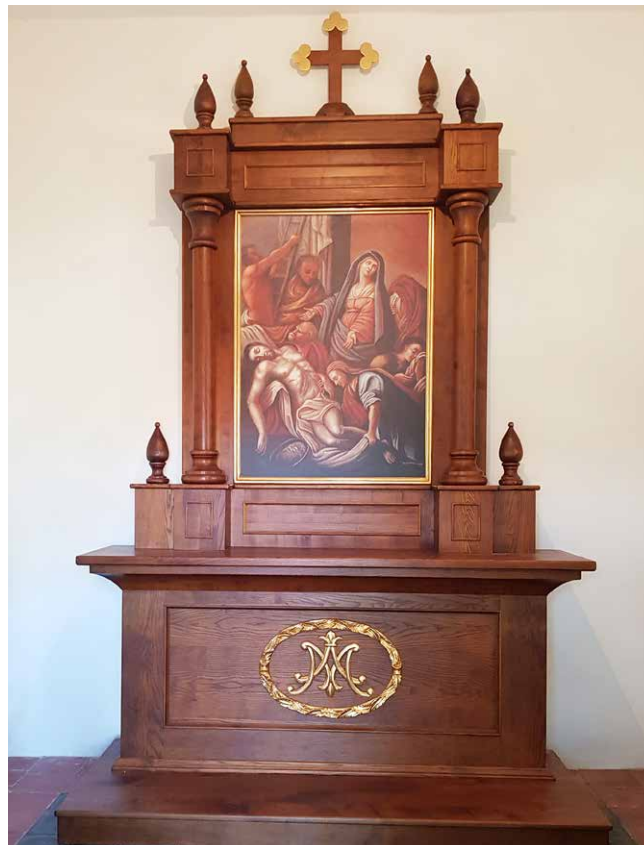
V truhlářově dílně v Turovce byl za pomoci běžných strojů a nářadí vyroben i kompletní oltář, který je od loňského roku součástí interiéru zrestaurované návěsní kaple v Hodějovicích