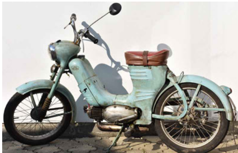
Dalším právě se rodícím dřevěným moto veteránem, kde Pavel Svoboda tentokrát začal u kol, je Jawa 50/550 – Pařez

nebo chromované díly jsem volil světlý javor a někdy (např. pro ráfky) buk, na které jsem ‚obul‘ dubové pneumatiky. Členitější díly (např. motor) jsem složil ze čtyř dřevin – dubu, švestky, javoru a smrku. V případě dubu jsem použil jak evropský, tak také americký a kromě již jmenovaných dřevin ještě bambus, borovice, břízu, habr, hrušku, jedli, jilm, lípu, mahagon, modřín, ořech, topol, třešeň a vrbu,“ upřesňuje autor motocyklu, na jehož výrobu kromě dřeva, lepidla pro spojení součástí a vosku či oleje pro povrchovou úpravu, nebyly použity žádné další materiály.