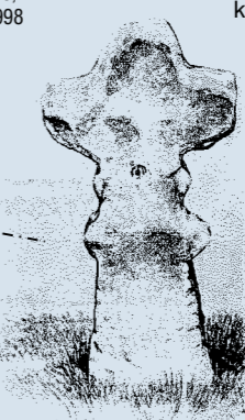
Kamenný kříž, který do r. 1840 stál na louce u studánky v Soutěškách na Děčínsku, kresba © Nataša Steinová