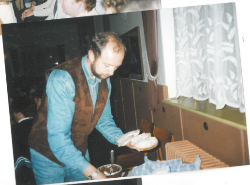
Gr�idsky' skil - - chlv, sadlv, cibule, svl