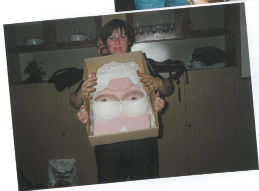
Livka od Miloty Pokačv divvkvim