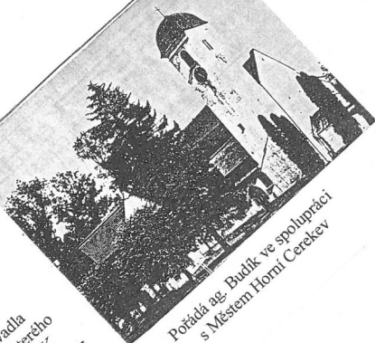
Pořádá ag. Budík ve spolupráci s Městem Horní Cerekev

Horní Cerekev kostel Zvěstování Panny Marie neděle 16. června 2002, v 19,00 hodin, vstupné 80,- Kč předprodej vstupenek na MěÚ Horní Cerekev